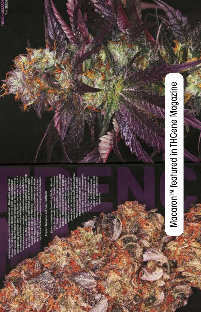
Macaron™ featured in THcane Magazine

French Macaron auf dem Prüfstand. Es war nur wieder der Grow-King The Doc, der sich mit großer Vorfreude einer neuen Cookies-Sorte von T.H. Seeds wundert. Die Keimung, Anzucht und Pflanzung zogen sich über einen Zeitraum von mehreren Wochen hin. Die Cookies-Sorte ist ein Hybrid aus French Cookies (Philly) und Sweet Sherbet (Gel-Sweet Cookies / Pine Pine) und French Cookies (Dutch) verpackt, das wenn zufällig in einem Baum im organischen GSC-22 gelandet ist.